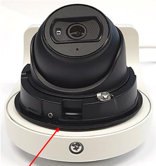
(E) Kamera auf die Adapterplatte aufsetzen und nach rechts drehen bis zum Anschlag