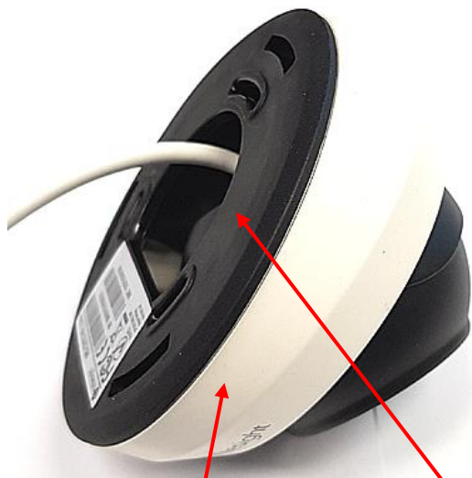
(A) Abdeckung weiss lösen, nach links drehen (B) Schwarze Adapterplatte lösen, nach links drehen