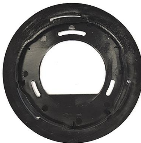
(C) Adapterplatte. Bei Abgesetzter Decke diesen Adapter montieren und die Kabel direkt durchführen