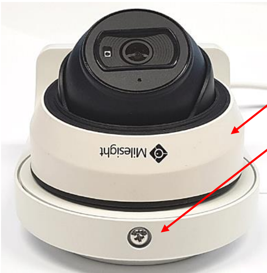
(G) Weisse Abdeckung wieder montieren