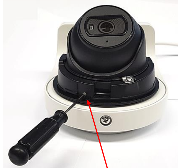
(F) Schraube anziehen, Kamera kann jetzt nicht mehr bewegt werden. (Diebstahlschutz)